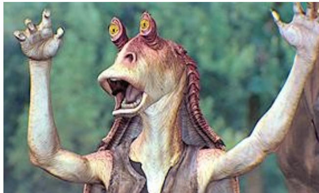
Jar Jar Binks

Jar Jar Binks is a fictional character in the Star Wars films The Phantom Menace , Attack of the Clones , and Revenge of the Sith . His primary role was intended to provide comic relief - based on his gangly way of walking and his unique speech accent. He is almost completely computer-generated : director George Lucas and his effects team were quick to hail this as a major technical breakthrough.